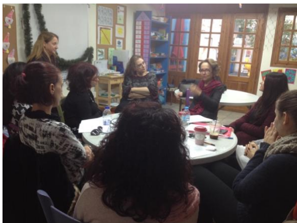
Εκπαίδευση εθελοντών HS Αθήνας

Η παραπάνω υποστήριξη προς τις οικογένειες έγινε από 24 εθελοντές που επισκέπτονταν κατ' οίκον τις οικογένειες ενώ άλλοι 7 εθελοντές πλαισίωσαν την υποστήριξη των οικογενειών όπου αυτή απαιτήθηκε.