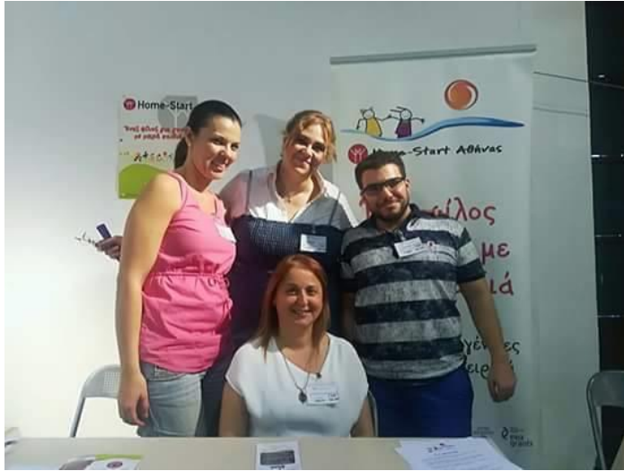
Συμμετοχή HS Αθήνας στο Φεστιβάλ Εθελοντισμού

Κατά το έτος αυτό η συνεργασία της Home-Start Ελλάς με το Home-Start Αθήνας ήταν συνεχής και τα αποτελέσματα της συνεργασίας αυτής θετικά. Τα θέματα της συνεργασίας αφορούσαν: