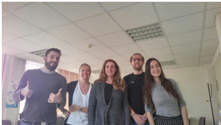
HS Piraeus volunteers

Τα αιτήματα των οικογενειών είναι ποικίλα. Όποιο όμως και να είναι το αίτημα, σε πρώτη φάση, το πρόγραμμα βοηθά την οικογένεια να ανταπεξέλθει στην καθημερινή της επιβίωση. Σε συνεργασία με άλλους φορείς καλύπτει υλικές ανάγκες (τροφήμα, ρούχα), ιατροφαρμακευτική περίθαλψη κ.α., ώστε στη συνέχεια να μπορέσει να ασχοληθεί απερίσπαστα με το κύριο αίτημα της οικογένειας.